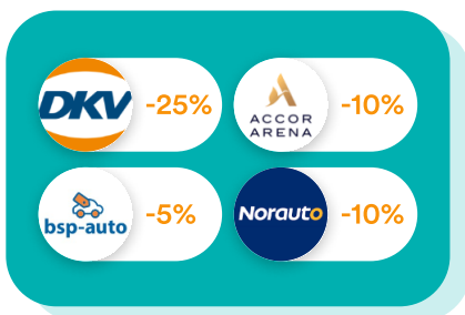
Véhicules & Déplacements