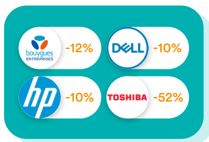
Informatique & Téléphonie