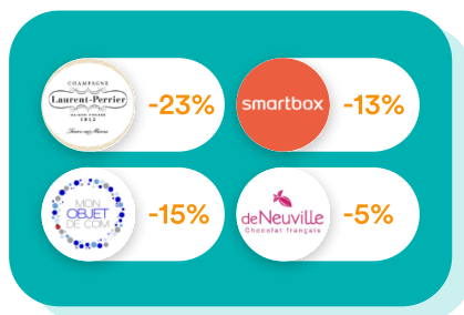
Goodies & Cadeaux