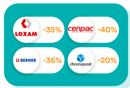
Logistique & Travaux