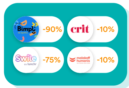
Finance & RH