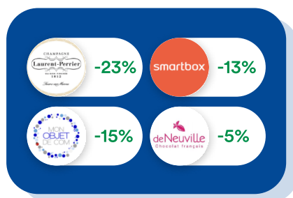
Goodies & Cadeaux