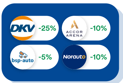
Véhicules & Déplacements