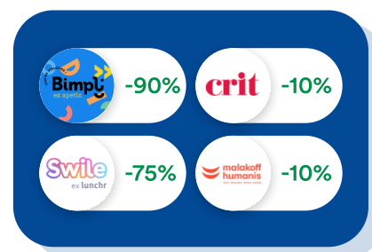
Finance & RH