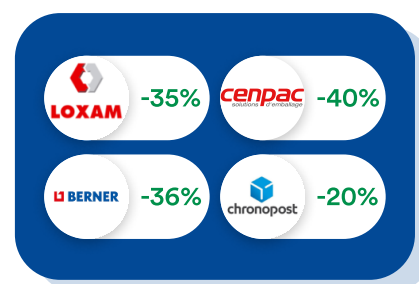
Logistique & Travaux