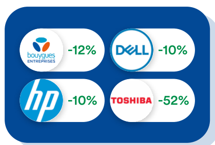
Informatique & Téléphonie