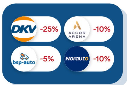
Véhicules & Déplacements