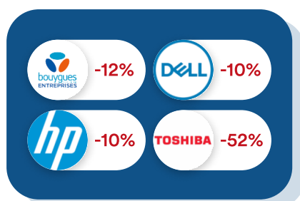
Informatique & Téléphonie