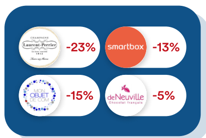
Goodies & Cadeaux