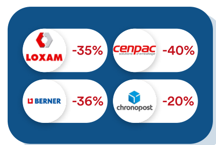
Logistique & Travaux