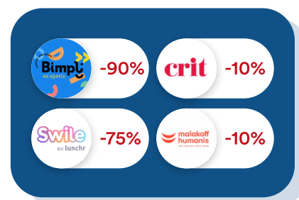
Finance & RH