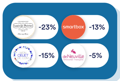
Goodies & Cadeaux