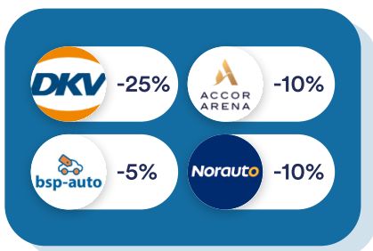
Véhicules & Déplacements