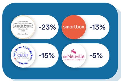
Goodies & Cadeaux