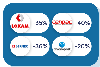
Logistique & Travaux