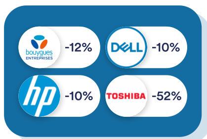
Informatique & Téléphonie