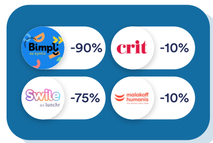
Finance & RH