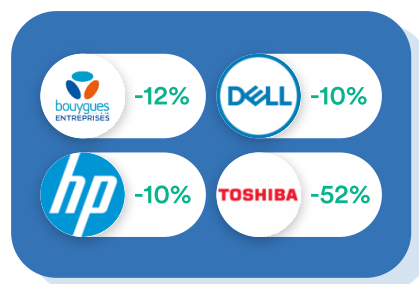
Informatique & Téléphonie