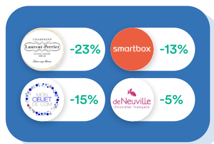
Goodies & Cadeaux