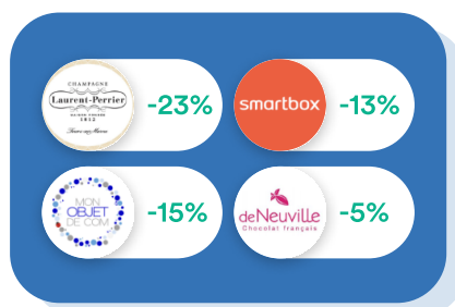
Goodies & Cadeaux