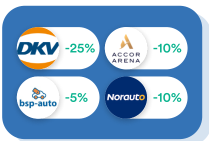
Véhicules & Déplacements