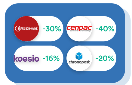
Logistique & Travaux