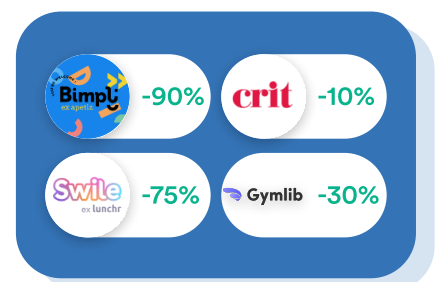
Finance & RH