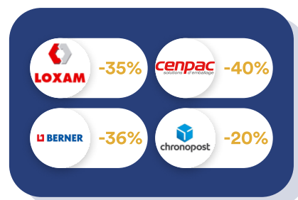
Logistique & Travaux