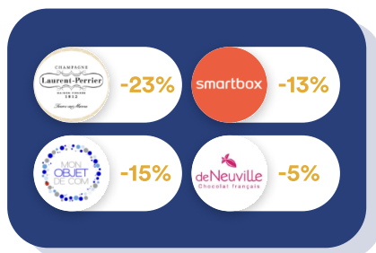
Goodies & Cadeaux