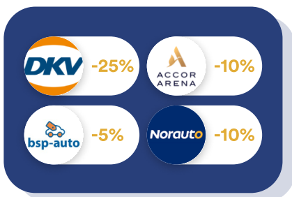
Véhicules & Déplacements