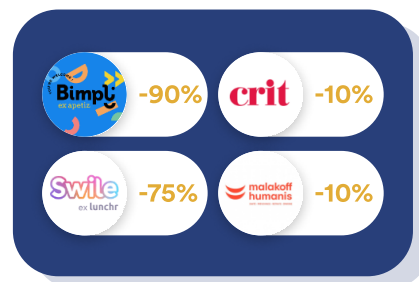
Finance & RH