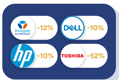
Informatique & Téléphonie