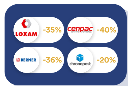
Logistique & Travaux