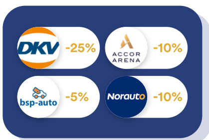
Véhicules & Déplacements