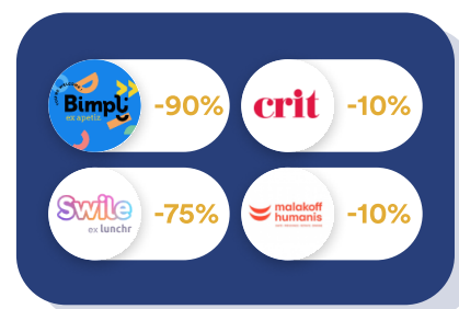
Finance & RH