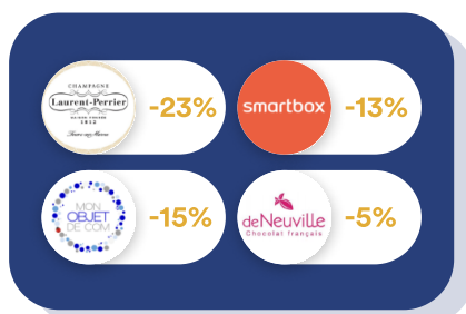
Goodies & Cadeaux