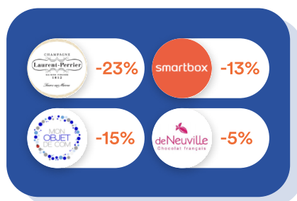
Goodies & Cadeaux