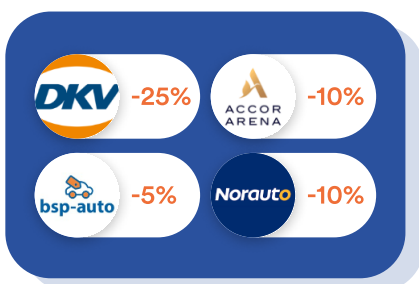
Véhicules & Déplacements