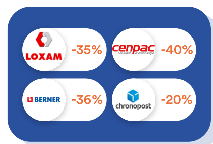
Logistique & Travaux