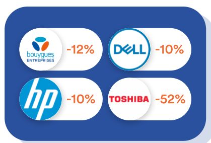
Informatique & Téléphonie