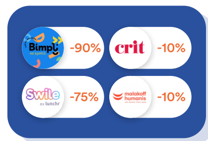
Finance & RH