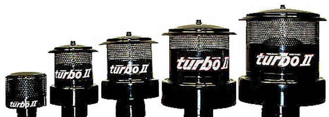
Modèle 13 18-37 KW Modèles 24 35-92 KW Modèle 35 88-132 KW Modèles 46 118-258 KW Modèles 68 220-405 KW