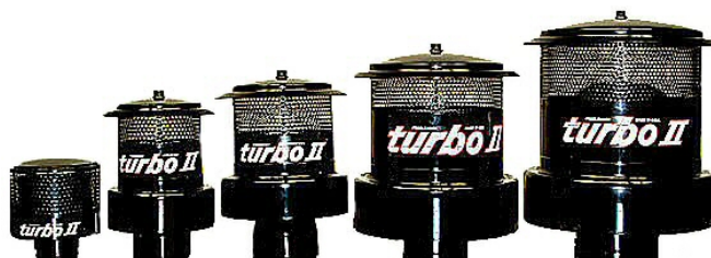
Modèle 13 18-37 KW Modèles 24 35-92 KW Modèle 35 88-132 KW Modèles 46 118-258 KW Modèles 68 220-405 KW