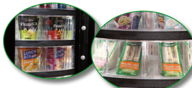
Evolution de la taille des portillons pour une distribution de produits plus volumineux