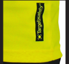
Ourlet au bas du tee-shirt.